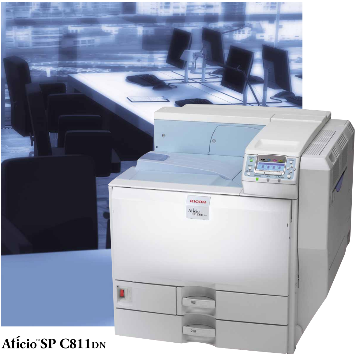
Aficio™ SP C811DN