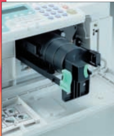
Toner e sviluppatori separati riducono i costi di manutenzione

Utilizzato con i più innovativi prodotti software, Nashuatec Document Solutions diventa parte integrante della rete di qualsiasi ufficio, migliorando le prestazioni, trasferendo più rapidamente i dati, e aumentando la produttività.