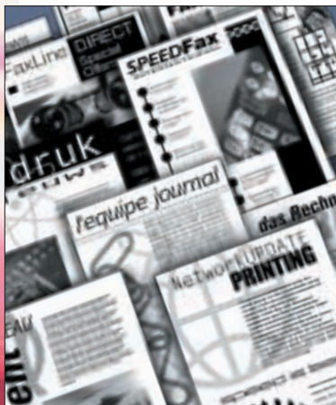
Fax veloce e stampante laser di alta qualità attraverso l'opzione scheda printer